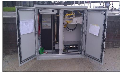
Cameratoezicht, zoals doorgaans voor vast cameratoezicht wordt gebruikt.