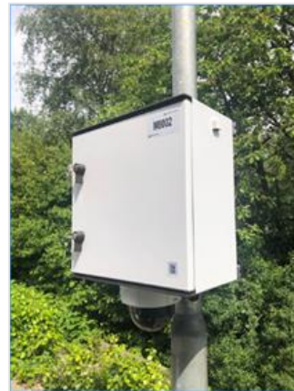
Cameratoezicht, zoals doorgaans voor flexibel cameratoezicht wordt gebruikt.