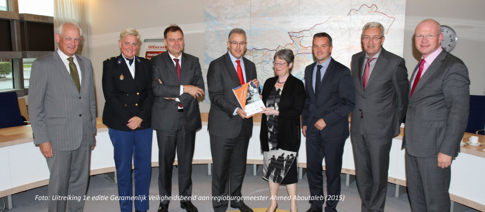
Foto: Uitreiking 1e editie Gezamenlijk Veiligheidsbeeld aan regioburgemeester Ahmed Aboutaleb (2015)