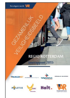
De eerste editie van het Gezamenlijk Veiligheidsbeeld verscheen in 2015.

De Veiligheidsmonitor is een landelijke monitor van het CBS over veiligheidsbeleving. De VAR coördineert de regionale deelname aan deze monitor.