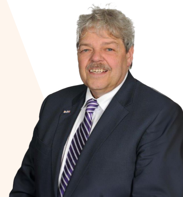
Oud-burgemeester van o.a. Vlaardingen en Leerdam

De voorzittershamer wordt meteen doorgegeven, want de heer Bruinsma vertrekt op dat moment uit de regio. In zijn nieuwe regio, als burgemeester van Alphen aan den Rijn en later Krimpenerwaard ervaart hij meteen het gemis van een regionale voorziening, zoals de BIV en VAR. Of dat een reden is geweest voor een terugkomst in de regio Rotterdam, als waarnemend burgemeester van Leerdam, laat hij in het midden. Een feit is wel dat hij meteen weer een vaste bezoeker wordt van de Leerhuizen en Carrousel.