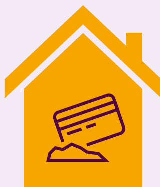
Opslag van harddrugs