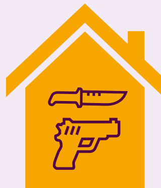
Opslag van wapens