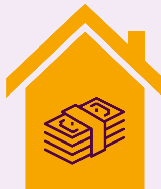
Opslag van geld