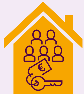
Zoveel mogelijk winst: hoge huur, veel huurders (illegalen, arbeidsmigranten)