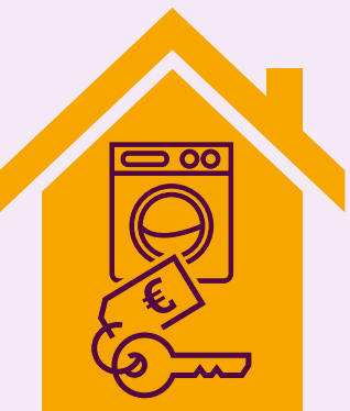
Witwassen door het innen van fictieve huren